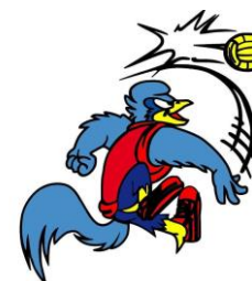
A.S. VOLANO VOLLEY

La realizzazione del Camp è in collaborazione con: