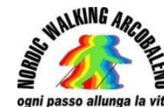
NORDIC WALKING ARCOBALENO ogni passo allunga la vita