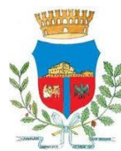
COMUNE di CALLIANO